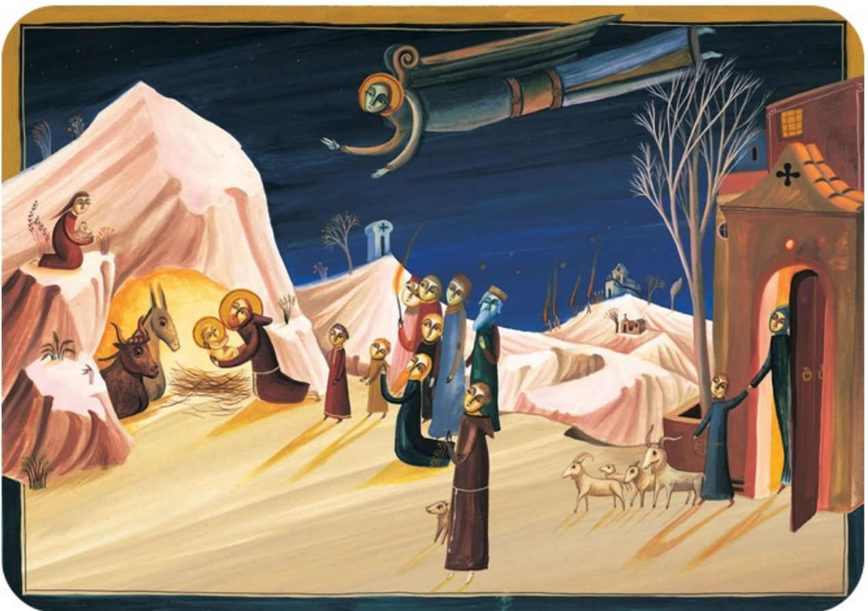
Tekening van Bimba Landmann uit het boek: Chiara e Francesco (Arka edizioni) © Il Castello srl, Via Milano 73/75, 20007 Cornaredo (Mi), Italy. All rights reserved.

franciscus ontmoet johannes in greccio vraagt hem of hij net voor kerst een kindje in een kribbe leggen wil, op stro en met een os en een ezel de man scheidt het tafereel in eenvoud en met hoop zo ervaren we hoe het kindje leed voor ons van ons mag kerstmis komen - twee lichtjes in de advent