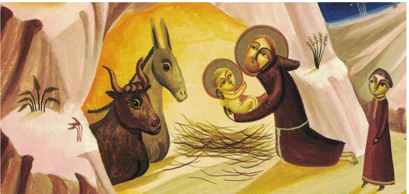
Tekening van Bimba Landmann uit het boek: Chiara e Francesco (Arka edizioni)