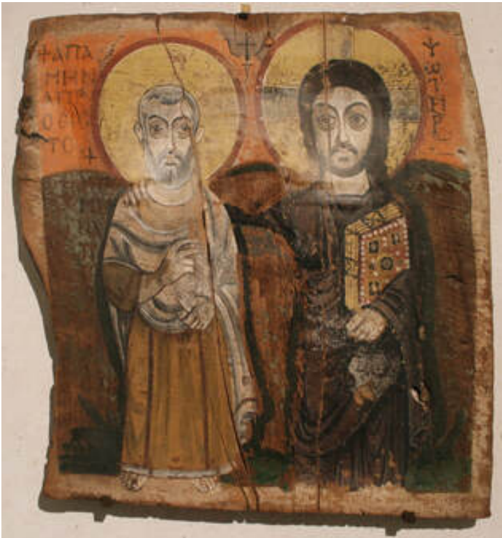
Icoon van de vriendschap