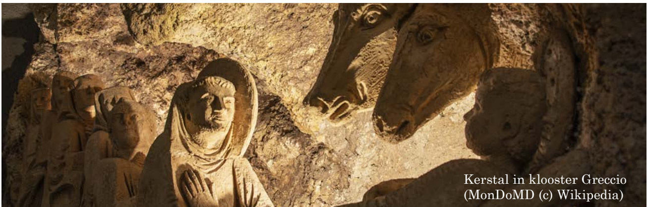
Kerstal in klooster Greccio

En zouden ze hun levenswijze daarop afstemmen?